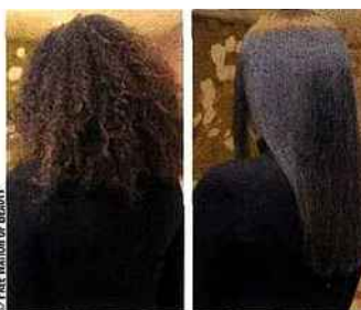
Avant et après traitement brésilien lissant à la kératine. Before and after Brazilian keratin treatment.

Côté soin professionnel, pour un lissage de longue durée, Free Nation of Beauty présente en exclusivité en France un traitement brésilien lissant et assouplissant à la kératine, dont les effets durent environ 4 mois. Mis au point au Brésil au début des années 2000, il est maintenant proposé dans la plupart des grands salons de coiffure. La kératine, protéine naturelle du cheveu, protège le cheveu des agressions extérieures (pollution, séchage, UV, eau de mer) et renforce l'imperméabilité du cheveu. Alors que les produits lissant traditionnels changent la structure moléculaire du cheveu et coupent les ponts disulfure responsables de la frisure, engendrant une fragilité et une déshydratation du cheveu, le traitement à la kératine (contenant 0,02 % de formaldéhyde) lisse le cheveu, le renforce et lui apporte protection, hydratation et brillance. La kératine contenue dans la formule est scellée dans la fibre capillaire grâce à la chaleur du lisseur à plaques céramiques (action semi-mécanique, comblement des brèches de la fibre capillaire). Free Nation of Beauty décline également toute une gamme de soins capillaires (contrôle volume, anti-frizz, réparateurs, apaisants avec le spray No Stress) ainsi qu'une gamme spécifique pour le corps (baume ultra-nourrissant, lait reflets d'or sublimateur, gommage unifiant) et des soins visage (antitache, matifiant, unifiant, gel nettoyant exfoliant).